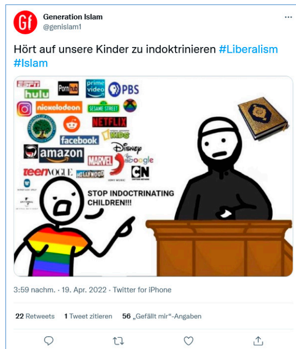
Abbildung 2: Generation Islam: Tweet vom 19.04.2022, in: Twitter, URL: https://t.co/RpOPx7SJoA [eingesehen am 05.07.2022].

Gleichzeitig wird jedoch mittels Abwertung „westlicher“ Kultur die „islamische“ aufgewertet: So ist ein häufiges Motiv die Heuchelei oder moralische Korruption des „Westens“. Dies bezieht sich zwar einerseits wiederum auf den Umgang mit Muslimen, andererseits aber auch auf Werte und Merkmale liberaler, säkularer Gesellschaften – etwa den toleranten Umgang mit sexuellen Minderheiten oder den relativ geringen Stellenwert von Religion. So spricht „Generation Islam“ im Zusammenhang mit der Berichterstattung des öffentlich-rechtlichen Rundfunks zu Transgenderthemen von „LGBTQ Wahn [sic]“ 19 und bezeichnet Europa als „gottloser als die USA“ 20 .